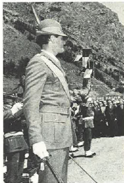
Oggi... nonostante tutto.