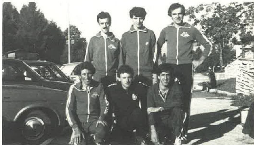
I nostri dinamici atleti.

Ai nostri bravissimi sportivi alpini, formuliamo il nostro più vivo compiacimento per i traguardi raggiunti e l'augurio più fervido di sempre più ampi piazzamenti.