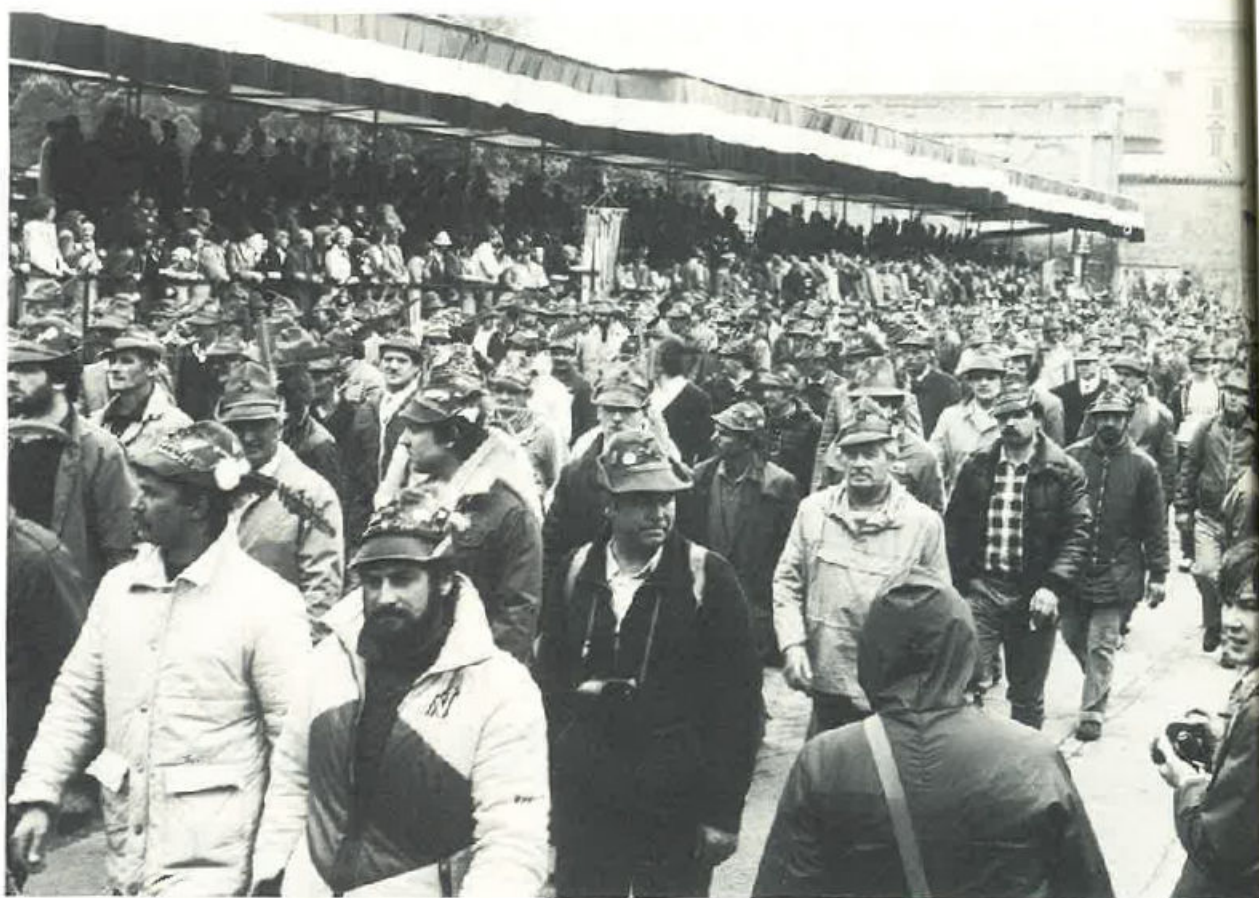
Avanzano i nostri Alpini.

Così con semplicità ed imponenza che sono proprie delle cose di montagna,