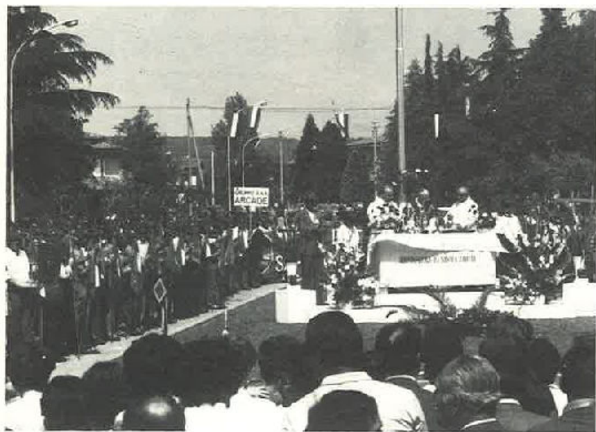
La celebrazione della S. Messa.

È questa la dimostrazione più esaltante che il retaggio di tradizioni e di storia tramandato di padre in figlio, anche in terra cusignanese è stato pienamente assimilato ed i magnifici Alpini di questo Gruppo, uno qualsiasi degli 89 che compongono la nostra Sezione Trevigiana. Hanno manifestato nella solennità di una cerimonia tanto significativa, un ideale unico: essere per gli altri, per la Patria, sempre i primi!