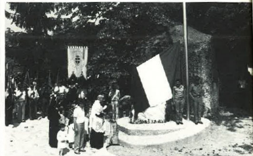
Inaugurazione del pennone alzabandiera.

La serata con il Coro della Julia, il cippo pennone con il tricolore, il fascicolo dei Caduti per la Patria, la nuova Sede per le Associazioni d'Arma, ricorderanno il ventennale del Gruppo, ma certamente resteranno a significare che gli Alpini amano l'Italia e sono vive componenti dei suoi valori.