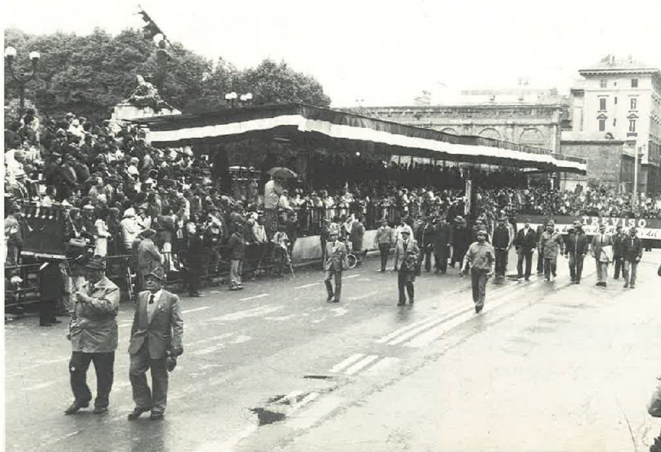
Sfila il vessillo della nostra Sezione.

Questo è un comportamento deleterio per eccellenza che ci ha fatto e ci farà a lungo meditare. Si è molto parlato di colorazioni politiche, di responsabilità, di mandanti e di esecutori, quando la strage tanto barbara quanto infamante, aveva già reclamato troppo sangue innocente e lì in quel tempio di dolore e di costernazione, gli Alpini hanno deposto il loro cuore, un fiore, un tricolore, una lacrima, suggellando innanzi a quella la-