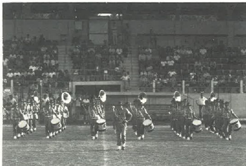
La fanfara della "Julia" invade il campo.

Entrano in campo due delle quattro squadre finaliste, per il 3° ed il 4° posto: il Roncade ed il Ponte di Piave che sia dopo i tempi regolari ed i supplementari, realizzano uno 0-0. La vittoria si è dovuta conquistare con i calci di rigore, dove il Roncade vinceva sul Ponte di Piave per 5-4.