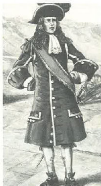
Fascia azzurra nel 1678.