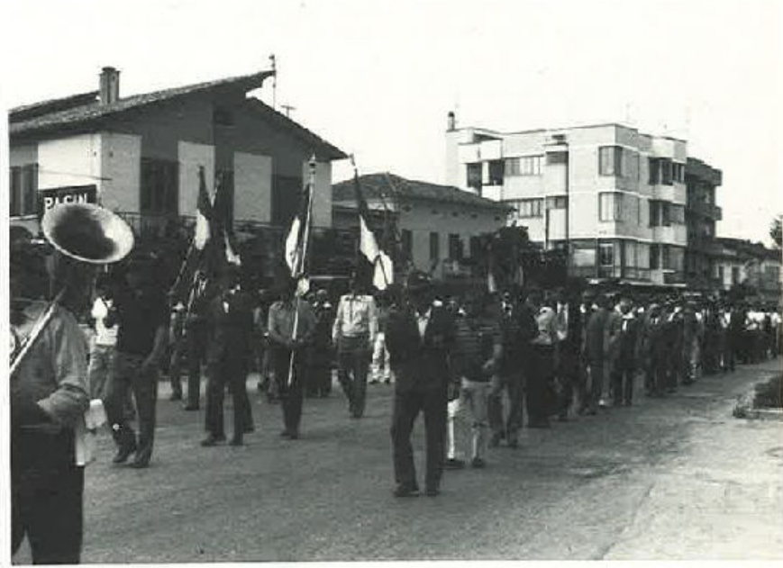
La sfilata per le vie del centro.